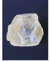
Cristal brut d'anorthite (Chine)