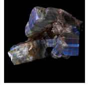
Ensemble de cristaux d'Azulite (variété de Sandine) (Mexique)