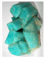
Bloc de cristaux d'Amazonite (variété de microcline) (USA)