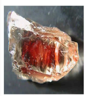
Pierre de soleil de l'Oregon (variété d'Andésine) (USA)