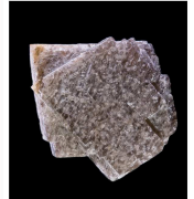
Macles de Carlsbad dans un bloc de Sandine Puy de Sancy (France)