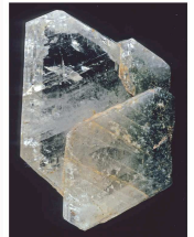
Cristaux d'Albite maclés (Crète)